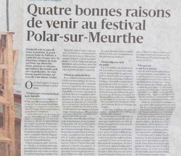
Quatre bonnes raisons de venir au festival Polar-sur-Meurthe