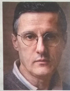
La soirée se veut immersive