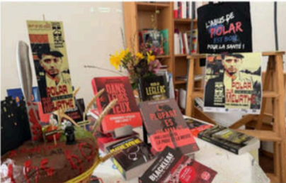
La deuxième édition de Polar-sur-Meurthe aura lieu cette année les 24 et 25 avril.

Le fait divers, réel ou littéraire, est-il ancré dans son territoire? Yuste débat auquel Polar-sur-Meurthe participera à l'occasion de sa deuxième édition organisée par la Librairie Le Neuf et ses partenaires. Elle se déroulera cette année le vendredi 24 en fin de journée et le samedi 25 avril toute la journée. Est le parking devant la librairie, c'est sous les arcades du châteaillon de l'architecte des Bâtiments de France que se déroulera le salon du livre avec les autrices et les auteurs en dédicace, la boutique aux perles, l'espace détente et le stand de De Auduiton, la boutique de jeux de la rue du Bâtiment qui rejoint l'événement. Parmi les noms de cette édition 2026 : Valerio Varesi, le