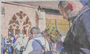
C'est dans le châteaillon de la cathédrale que les stands des auteurs se sont installés pour la journée.

Ce samedi 21 avril, différents lieux emblématiques de la ville de Saint-Dié se sont transformés pour accueillir la deuxième édition du festival Polar-sur-Meurthe: le châteaillon de la cathédrale, la Boussolle, le Grand Arts et le bar Les Deux Rives ont été transformés en salons de lecture, d'échanges et de débats. Bien sûr, un temps fort ont été les conférences et ateliers proposés aux auteurs. Les conférences ont été animées par des auteurs de renom, mais aussi par des auteurs locaux. Les ateliers ont permis de découvrir les techniques d'écriture de différents auteurs. Les ateliers ont été animés par des auteurs de renom, mais aussi par des auteurs locaux. Les ateliers ont permis de découvrir les techniques d'écriture de différents auteurs.